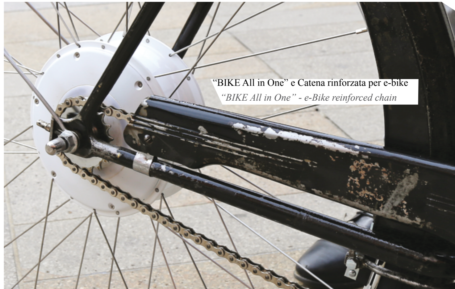
“BIKE All in One” e Catena rinforzata per e-bike “BIKE All in One” - e-Bike reinforced chain